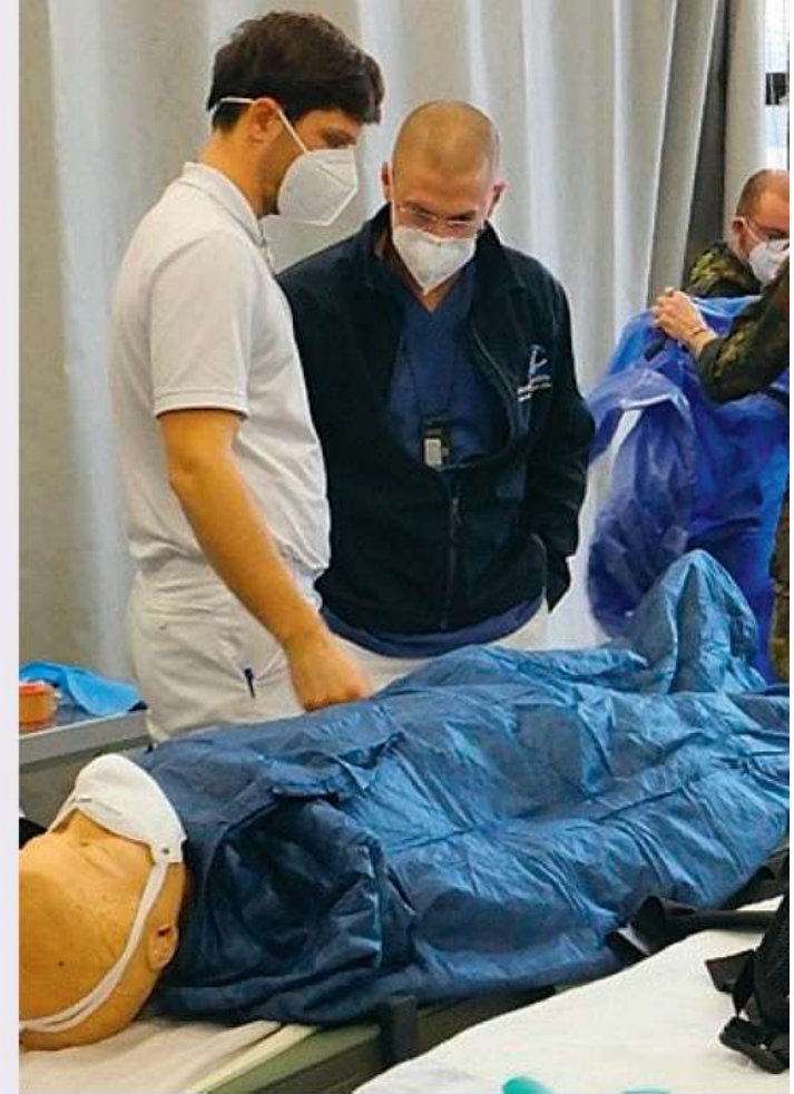
4. Transport in ZINA